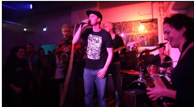
Jamsessions machen Spaß – und bringen Ideen für neue Songs

„Jammen“ ist ein Begriff aus dem Jazz und bezeichnet das gemeinsame Improvisieren oder Spielen bekannter Melodien. Bereits in den 1940er Jahren trafen sich Jazz-Musiker zu sogenannten Jamsessions. Dadurch bekam die Jazzmusik neue Impulse. Heute wird der Begriff auch in anderen Musikrichtungen verwendet, z. B. im Hip-Hop. Dabei spielen die Musiker gemeinsam auf der Bühne oder treten in einer Art Wettbewerb gegeneinander an (das nennt man dann einen „Battle“). Diese Jamsessions trugen auch dazu bei, dass sich in Deutschland eine richtige Hip-Hop-Community entwickelt hat.