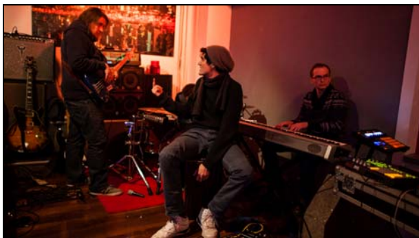
„Das wird eine geile Party!“

„geil“ ist ein Begriff, der von jungen Menschen häufig verwendet wird – das allerdings bereits seit den 1980er Jahren. Eigentlich stammt das Wort aus der Botanik. Im 15. Jahrhundert wurde es verwendet, um besonders gerade gewachsene Bäume zu beschreiben. Später bekam es eine sexuelle Konnotation und bedeutete „sexuell erregt“. Wer heute das Wort verwendet, meint meist, dass etwas „cool“, „super“ oder „sehr gut“ ist. Auch in der Werbung oder in Liedtexten wird das Wort immer mehr verwendet. Trotzdem sollte man darauf achten, in welchen Situationen man es sagt: Ebenso wie das Wort „scheiße“ gehört es zur Umgangssprache.