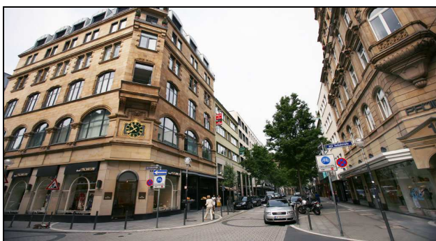
Goethestraße Frankfurt am Main

Der Kurfürstendamm im Westen Berlins ist eine weltberühmte Einkaufsstraße. Sie ist 3,5 Kilometer lang und besteht heute aus einer Mischung von alten Gebäuden und modernen Glasbauten. Im Jahr 2011 feierte der Kurfürstendamm sein 125-jähriges Jubiläum. Die beliebte Einkaufsmeile trägt den Spitznamen „Kudamm“.