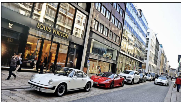
Neuer Wall Hamburg