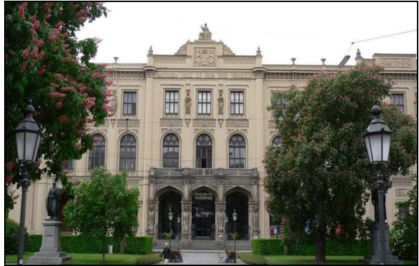
Das Staatliche Museum für Völkerkunde zeigt seit 1926 Kunst und Kultur aus Afrika, Amerika, Asien und Ozeanien

In der historischen Maximilianstraße residieren auch einige namhafte Kunst- und Kulturhäuser: Das Staatliche Museum für Völkerkunde – mit mehr als 150 000 Exponaten, das Residenz – und das Nationaltheater, das GOP Varieté-Theater und die Münchner Kammerspiele, die oft moderne Inszenierungen zeigen. Die berühmte Bayrische Staatsoper zählt mit rund 350 Vorstellungen pro Jahr zu den produktivsten Opernhäusern weltweit. Die Münchner Opernfestspiele, gegründet 1875, sind die ältesten der Welt.