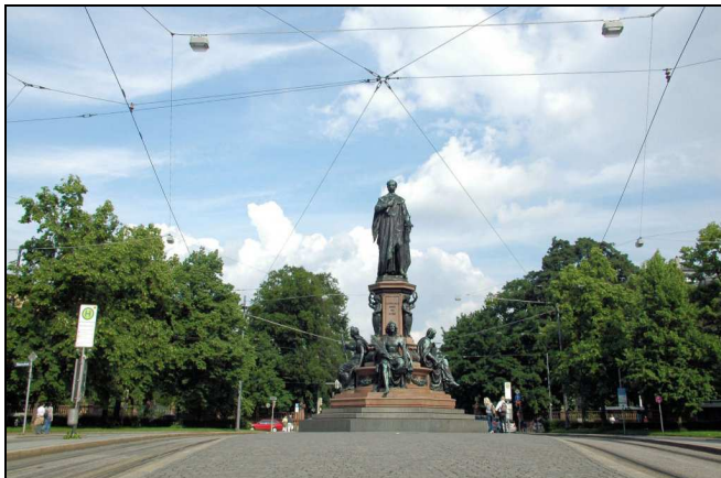
Das Maxmonument, kurz vor der Brücke über die Isar, erbaut 1867-1875

In der Mitte der Maximilianstraße wurde zur Ehren ihres Namensgebers, des bayerischen Königs Maximilian II., das Maxmonument errichtet. Auf einem Podest aus rötlichem Granit steht die fünf Meter große Bronzefigur des Königs. Die Statuen auf dem Sockel symbolisieren die Tugenden der Staatskunst: Friedensliebe, Gerechtigkeit, Stärke und Weisheit. Das heute unter Denkmalschutz stehende Maxmonument ist das Werk des Bildhauers Kaspar von Zumbusch.