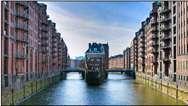
Die Speicherstadt – ein Wahrzeichen Hamburgs

Die Speicherstadt ist ein Teil Hamburgs und gleichzeitig ein Wahrzeichen dieser Großstadt. Ab 1883 wurde sie erbaut. Sie besteht aus dem weltgrößten zusammenhängenden Block von Lagerhäusern. Die Lagerhallen sind auf Eichenpfählen errichtet. In der Speicherstadt gibt es mehrere Kanäle, die mit Wasser gefüllt sind und je nach Gezeiten von Schiffen befahren werden können. Nachts werden die Gebäude von bis zu 800 Scheinwerfern angestrahlt, sodass die Speicherstadt gerade bei Dunkelheit ein beliebtes Ziel von Touristen ist. Seit 1991 steht der Stadtteil unter Denkmalschutz.